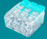
XM-266 3 POLOS