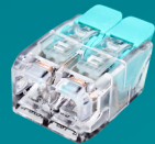
XM-266 2 POLOS