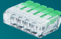
XM-26 5 POLOS