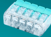
XM-266 5 POLOS